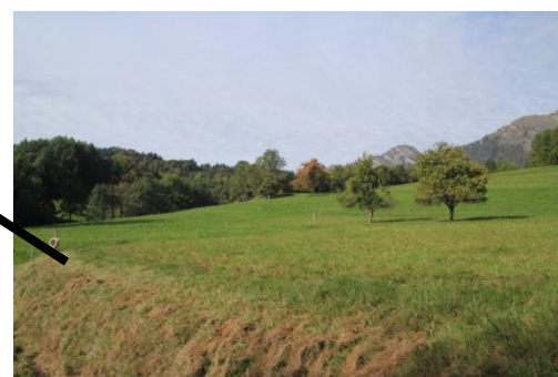
Les terrains et la ferme que nous achetons à Thénésol à 5 km d'Albertville