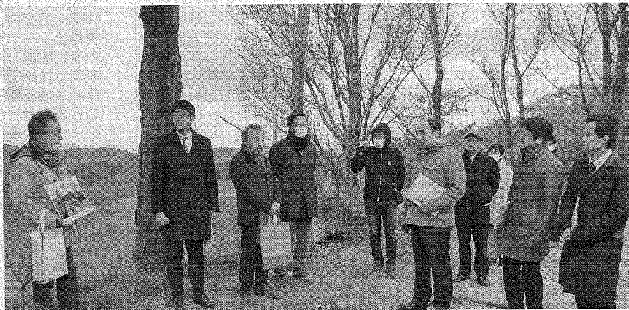
牧場を見渡す場所から検証する裁判長ら(右端3人)＝10日、川俣町山木屋