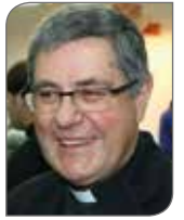
ÁNGEL M. PASCUAL

Domingo 2º de Cuaresma Gn 22, 1-2.9-13 / Sal 115 / Rm 8, 31b-34 / Mc 9, 2-10