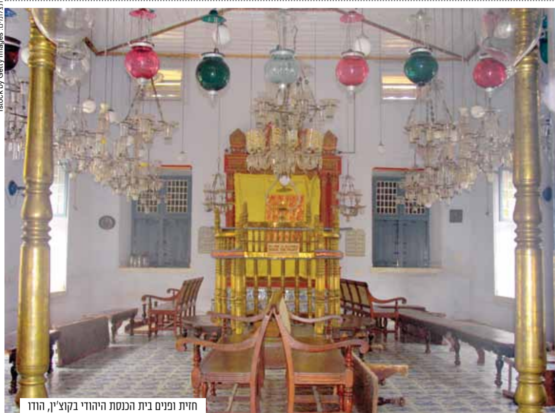
חזית ופנים בית הכנסת היהודי בקוצ'ין, הודו