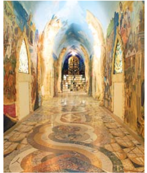
המנוך, מקדשי האנושות

ומברכים אותי ב-"Con Te" (בעברית: "אני איתך"). מאוחר יותר הם מסבירים שחייהם מתבססים על הענקת משמעות לדברים, לכל הדברים. מפגש בין אנשים משמש הזדמנות להיזכר בטבענו האלוהי המשותף, ולפיכך הם אינם משתמשים במילים "היי" או "צ'או". "מנקודת המבט הזאת, כל דבר יכול להיות רוחני", מרחיב אורניטורינוקו, "אבל האתגר של כל בני האדם הוא להבין שלכולנו יש שורש משותף, גם אם האמונות שלנו שונות. דווקא השונות בינינו היא שמאפשרת לנו להעניק ערך לאחרים. בדמנהור אנחנו רואים בכך אהבה, שאותה אנחנו מבקשים לבטא גם במעשים. מקדש האנושות, למשל, הוא סמל פיזי של הגישה הזאת. הוא מקדש של האנושות כולה, ולא של היבט אחד שלה, מכיוון שכל היבט מהאנושות חשוב, מיוחד ובעל ערך באינטגרציה של נשמתה. זהו מחקר חי שבו האלוהות אינה דבר קבוע, אלא תלויה בהבנה שאנחנו מסוגלים ליצור באותו זמן". מתברר כי המחקר הכי משמעותי בדמנהור הוא המחקר על מהות האנשים, מחקר שאינו רק בודק הבנה אלא בעיקר עוסק במעשים. כיום דמנהור היא פדרציה אוטונומית של קהילות שפזורות בטווח של כ-25 קילומטר ברחבי עמק ואלקיוסלה. יש לה חוקה משל עצמה, תרבות, אמנות, מוזיקה, בתי ספר ואפילו מטבע מקומי. "לפני כ-40 שנה זו הייתה קבוצה קטנה של מייסדים, אבל מאז