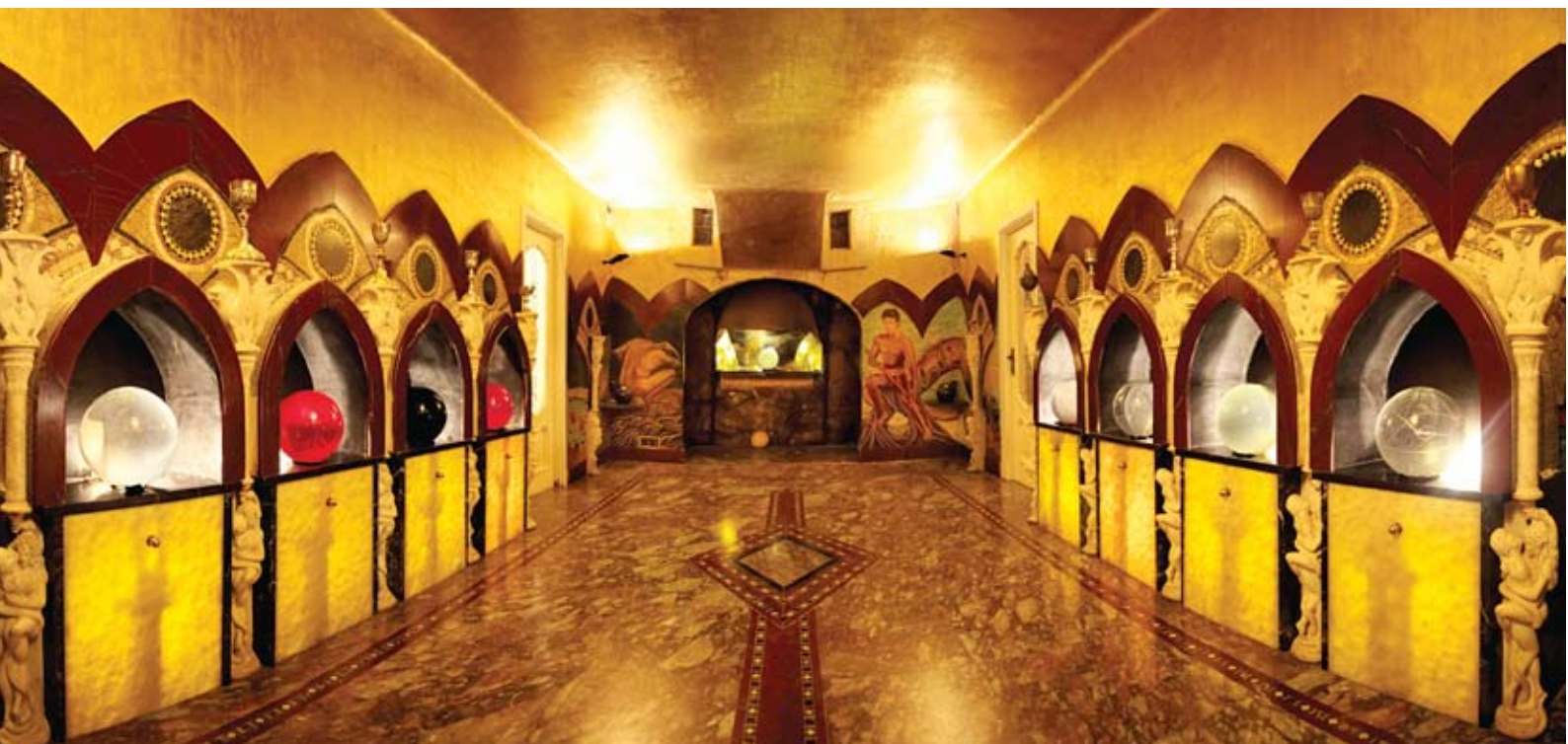
חדר הספרואידים (כדורי הבדולח), מקדשי האנושות

אין מילים שיתארו את יופיים של האולמות ושל החדרים השונים במקדשי האנושות. זהו אינו יופי במונח הרגיל שלו, זה שאנחנו רואים בעין, אלא יופי שאפשר לחוש בלב. עוד לפני שהמוח מספיק לקלוט את העושר המתבטא בחומרים, בצבעים ובצורות, משהו בפנים נוגע עמוק ומהר; עוטף. לאחר מכן כל אחד רואה, חווה ומבין את המקדשים בצורה אחרת