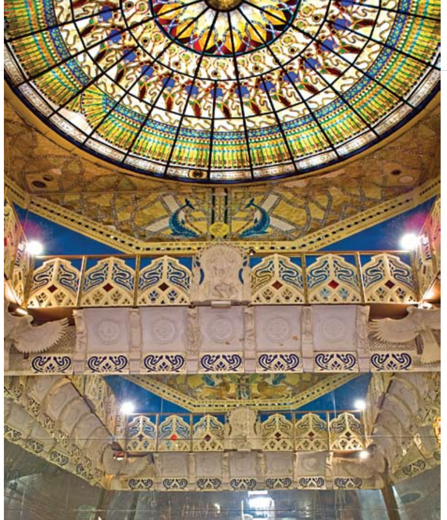
אולם המראות, מקדשי האנושות

שנייה אחראית על מקדשי האנושות, ומשפחה אחרת דואגת ליער שמעל המקדשים וחוקרת אותו. כל אדם בוחר לגור היכן שהוא מרגיש שמתאים לו מבחינת המיקום, האנשים והפונקציה של הקהילה.