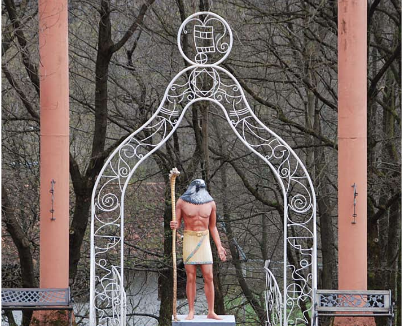
האל הורוס משקיף על המקדש הפתוח

משחק החיים מייצג ערכים של שינוי, של יצירתיות ושל חוש הומור, שמהווים חלק בלתי נפרד מהחיים האישיים והקהילתיים בדמנהור. כשפלקו, מייסד הקהילה, זיהה שהקהילה המייסדת נכנסה לשגרה, הוא חזר עם קבוצה חדשה ויצר משחק של מלחמת דגלים בין ותיקים לחדשים. מאז החלה מסורת של משחקים קהילתיים המאלצים את התושבים לפתח את דמיונם ולצאת מאזורי הנוחות שלהם