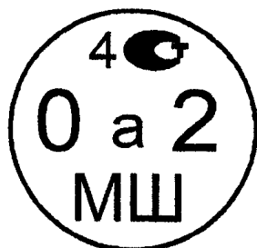
Рисунок 4.1. Знак поверки государственного регионального центра метрологии