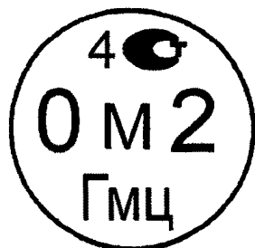
Рисунок 4.2. Знак поверки государственного научного метрологического института