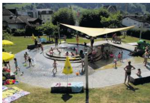
Kinderbecken Schwimmbad Ebnat-Kappel

Gerne erfährt die Gemeinde, was Ihnen im Schwimmbad besonders gefallen hat und welche Änderungswünsche bestehen. Dazu findet eine Umfrage zum Schwimmbadbetrieb 2018 statt. Ein Fragebogen dazu ist im Schwimmbad und im Front Office verfügbar oder kann auf der Webseite heruntergeladen werden. Den Fragebogen zur Kundenumfrage und die aktuellen Infos über die Öffnungszeiten finden Sie auf www.ebnat-kappel.ch unter «Schwimmbad».