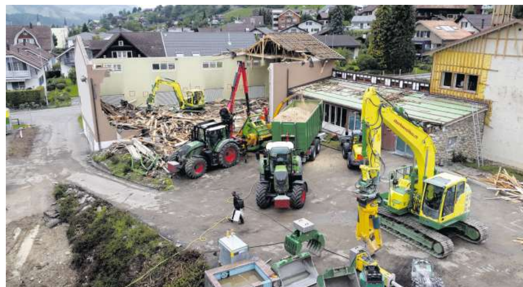
Abbrucharbeiten Turnhalle und Schulhaus Wier I

Plan, werden die Abbrucharbeiten Ende September abgeschlossen, damit nachfolgend mit dem Baugrubenaushub gestartet werden kann.