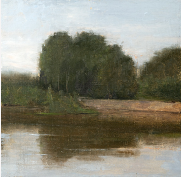
אלדר פרבר 2019 Eldar Farber