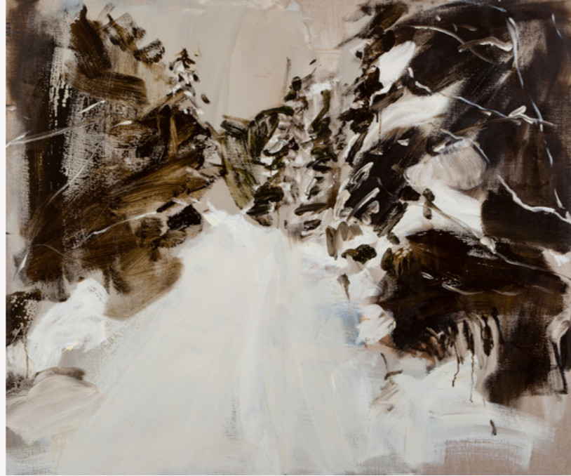
גדעון רובין 2013