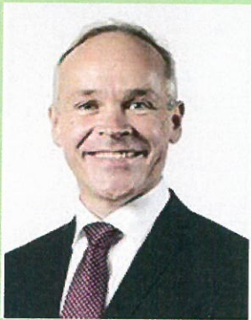
Statsråd Jan Tore Sanner, KMD