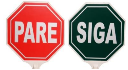
Paleta Plástica Pare-Siga