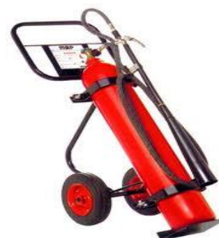
Ref:EA- : Extintor CO2 GAS CARBONICO, de 10, 15,20 y 50 Libras. su característica especial es su agente extintor el cual no deja ningún tipo de residuos , apaga a base de enfriamiento