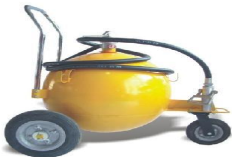
Ref:EA-150LBS : Extintor SATELITE MULTIPROPOSITO de 150 Libras, Tipo Industrial es utilizado para establecimientos bastante amplios, bodegas. Estaciones de Servicio de