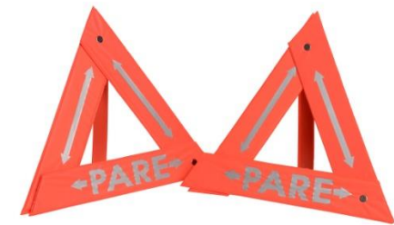
Señalización Tipo Triangulo