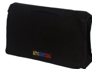
Maletín Herramienta Vehículo