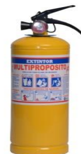
Ref:EA-30LB : Extintor Multipropósito tipo ABC de 30 libras