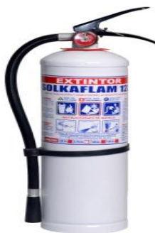
Ref:EA-9GS: Extintor SOLKAFLAM de 9.000 Gramos, su característica especial es su agente extintor el cual no deja ningún tipo de