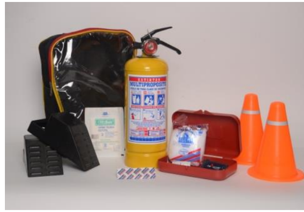
Kit de Carretera contiene: Extintor Multipropósito ABC de 5 Libs, Tacos, Conos, Mini botiquín; dentro de un maletín de lona