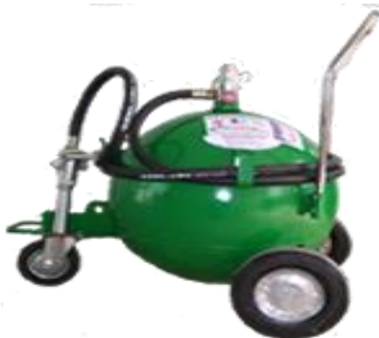
Ref:EA-20 GLS: Extintor SATELITE de Agua de 20 Galones, Tipo Industrial es utilizado para establecimientos bastante amplios, bodegas, Etc.