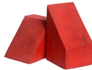
Tacos en Madera Tamaño Pequeño, Mediano y Grande