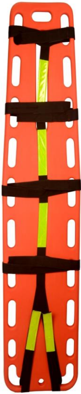
Camilla Traslucida con Arnés Reflectivo