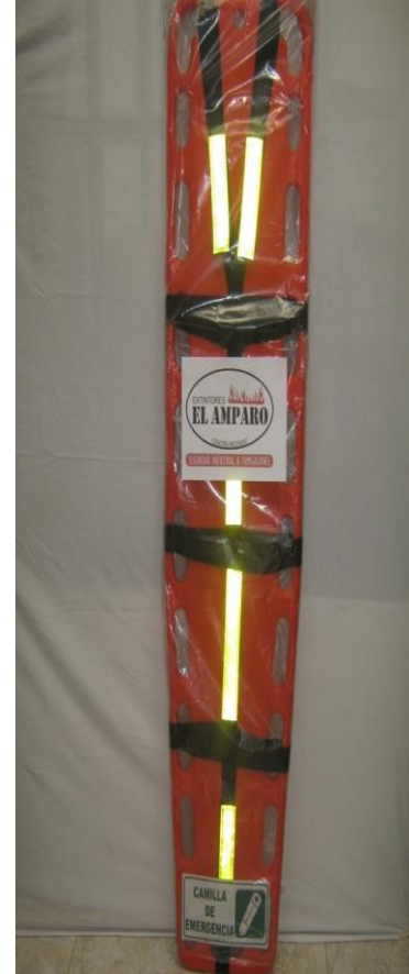
Camilla Traslucida Arnés Reflectivo