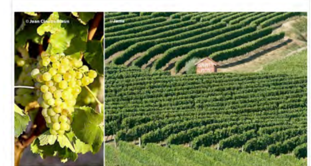
Saint Mont Vignoble en Fête le grand rendez-vous œnologique du Gers

Publié par Alain Etcheburu (/alain-etcheburu.html)