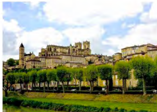
Auch et la cathédrale Sainte-Marie dont le chœur contient 113 stalles en chêne massif.

LA TIERRA QUE PROMUEVE EL TURISMO 'SLOW' De la mano de D'Artagnan