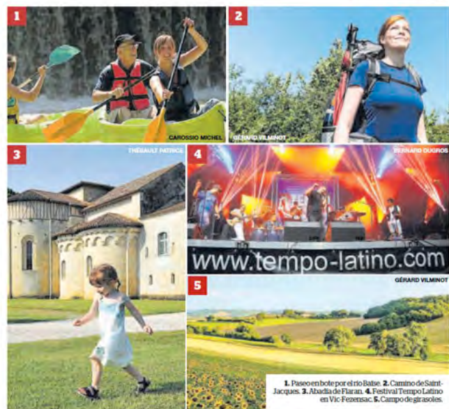
1. Paseo en bote por el río Baïse. 2. Camino de Saint-Jacques. 3. Abadía de Fauran. 4. Festival Tempo Latino en Vic-Fozenzac. 5. Campo de girasoles.

LA TIERRA QUE PROMUEVE EL TURISMO 'SLOW' De la mano de D'Artagnan