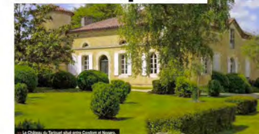
Le Château du Tariquet situé entre Condom et Nogent.