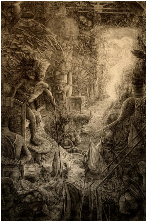
Quentin Spohn, Sans titre , 2013, pierre noire sur toile, 400 x 250 cm

A travers des dessins réalisés à la pierre noire, série qu'il a commencée alors qu'il était encore étudiant à la Villa Arson de Nice, il met en image sa perception de la société et ses propres obsessions. Ses tableaux fourmillent de personnages et de détails, associant des idées et des images qui renvoient au dessin satyrique ou à l'imagerie fantastique. Inspiré par des mouvements picturaux qui proposent un point de vue critique sur le monde, il puise aussi dans l'iconographie surréaliste, la bande dessinée et la culture populaire.