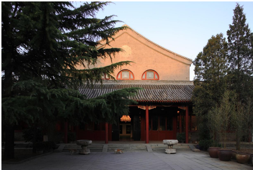
La maison des arts Yishu 8 à Pékin

Le prix Yishu 8 2016 sera remis le 26 novembre 2015 à 19h à l'Ecole des Beaux Arts de Paris – 13, Quai Malaquais Paris 6 ème .