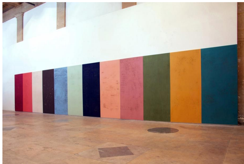
Clémence Roudil Wallpaintings