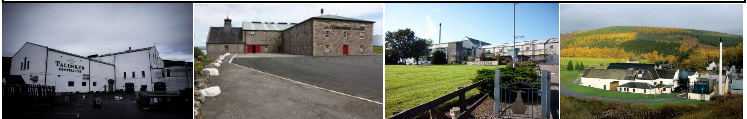
●各地視察先概要(1部の蒸留所)●