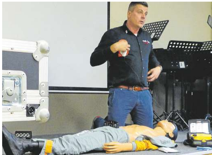
Schritt für Schritt wurde die Wiederbelebung demonstriert.