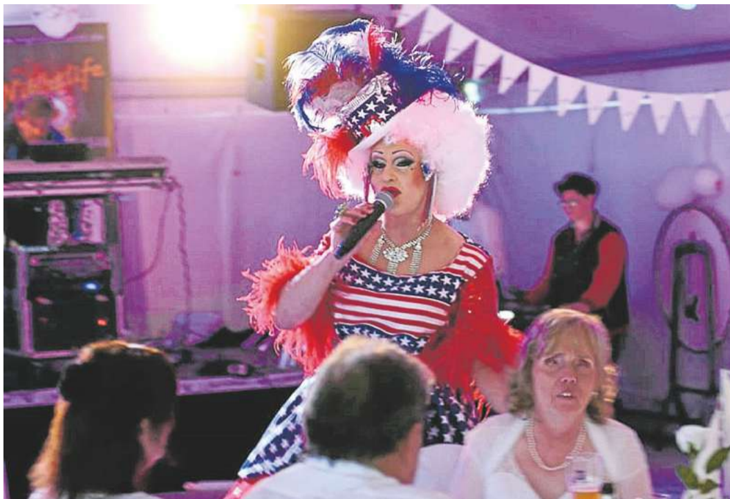
Die Herren Damen lassen bitten: Aber mit viel Herz und einem Zwinkern, bitteschön.

Karten für die Revue gibt es beim Stadtmarketing Holzminden, Markt 2, täglich 10 bis 16 Uhr, sonnabends 10 bis 13 Uhr) oder auf der Seite www.sternstunden-der-travestie.de .