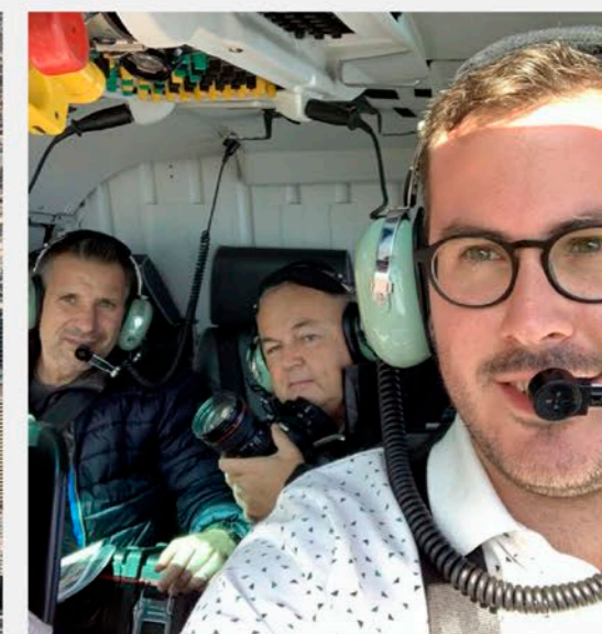
La petite équipe de 4 Vents dispose aussi de ses propres avions.