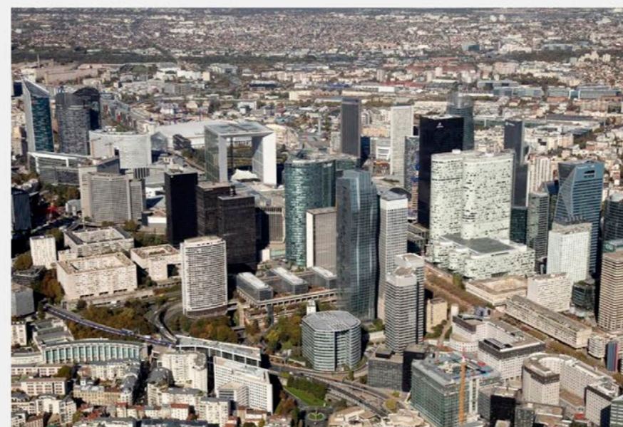
Le quartier de la Défense vu d'hélicoptère.