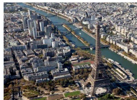
La P. 23 est une des zones les plus fermées au survol aérien.