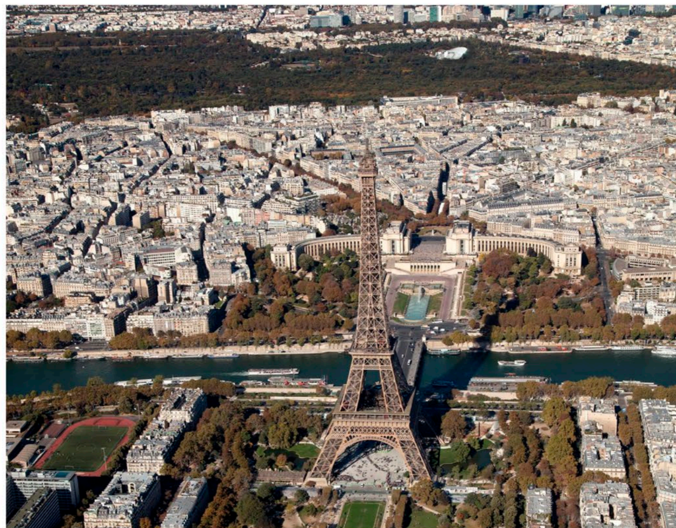
Un point de vue exceptionnel de la Tour Eiffel avec le Trocadéro en toile de fond et, au loin le musée Vitton.

> Plus de photos sur www.estrepublicain.fr