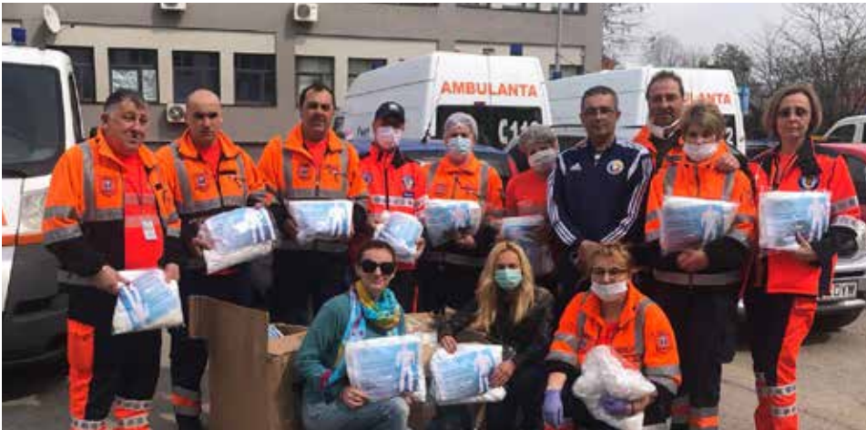
SERVICIUL DE AMBULANȚĂ