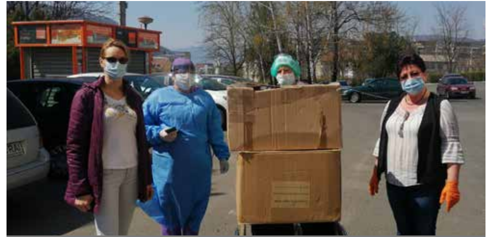
SPITALUL JUDEȚEAN DE URGENȚE NEAMȚ