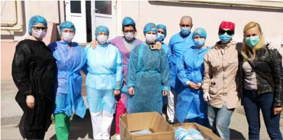
SPITALUL DE BOLI INFECȚIOASE TÂRGOVIȘTE