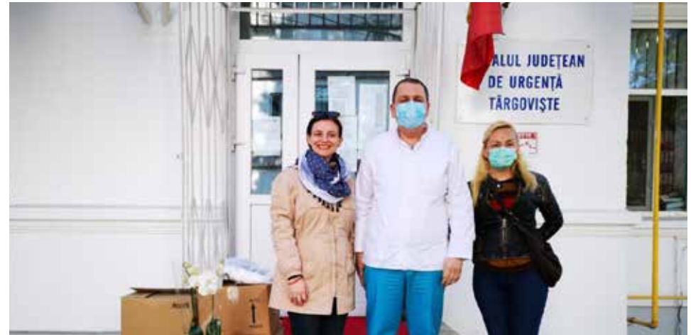
SPITALUL JUDEȚEAN DE URGENȚĂ TÂRGOVIȘTE

Asociația TOTUL ESTE POSIBIL nu are niciun angajat plătit. Toată activitatea asociației se bazează pe voluntariat.