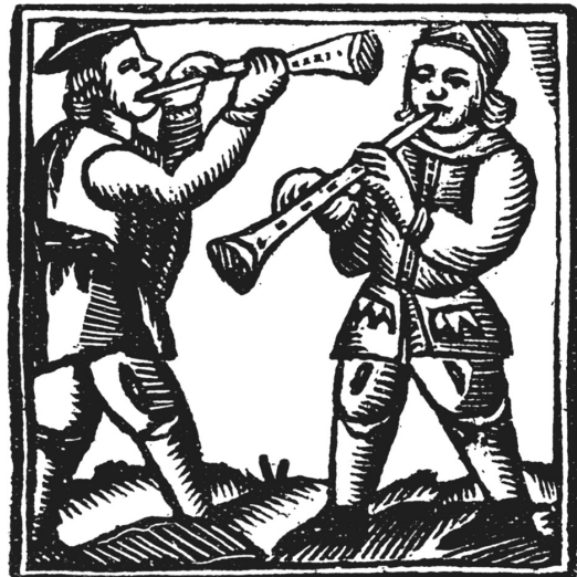
En les caramelles mai no mancaven els músics.

El dia de Pasqua varia cada any i depèn de les llunes: pot escaure's entre el 22 de març i el 25 d'abril, i és sempre el diumenge següent després de la primera lluna plena a partir de l'equinocci de primavera.