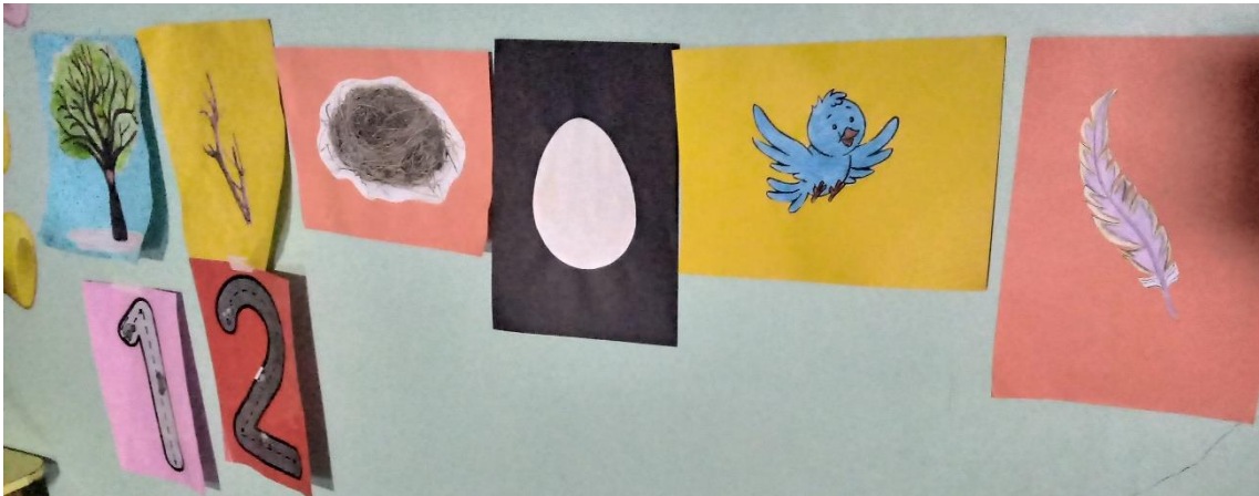
Sequencia Numérica e imagens (árvore da montanha).