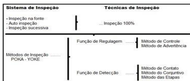
Figura 1. Esquema para realizar a escolha do Método Poka Yoke (fonte: Shingo, S.; 1996)

A escolha de um método Poka-Yoke é a etapa mais importante quando se pensa em controle de risco de um serviço. A inspeção é o objetivo, o Poka-Yoke é simplesmente o método (Shingo, 1996). O primeiro passo é a escolha do método de controle de qualidade específico do serviço, em seguida qual será usado, se controle ou advertência. Somente depois de definido o método apropriado deve-se considerar o design do dispositivo Poka-Yoke, podendo ser contato, conjuntivo ou etapas. (Shingo, 1996)