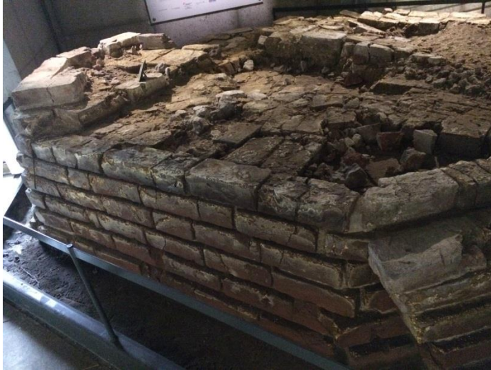
Foto: Een van de pilaren die te zien is in het ondergrondse museum, in het midden opgevuld met misbaksels.