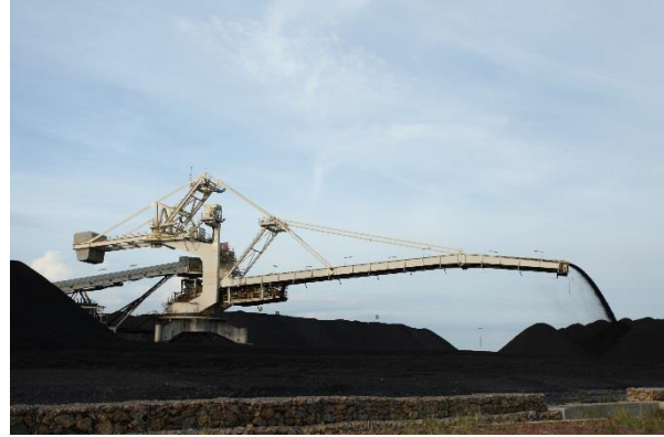
Coal Preparation Plant

Operasional perusahaan di PT MP maupun PT NTP secara konsisten telah memberikan kontribusi yang positif terhadap pertumbuhan perseroan. Pada laporan triwulan I Perseroan, kontribusi bagian laba dari PT MP dan PT NTP bersih setelah pajak adalah sebesar USD 31,9 Juta yang meningkat sebesar USD 10,9 Juta bila dibandingkan dengan triwulan I tahun 2016 seiring dengan perbaikan efisien dan pola kerja manajemen yang lebih efektif. Kontribusi tersebut selanjutnya memberikan dampak positif terhadap peningkatan laba neto Perseroan menjadi sebesar USD 12,7 Juta di triwulan I tahun 2017 dari sebelumnya rugi sebesar USD 1,9 Juta di trwulan I tahun 2016.