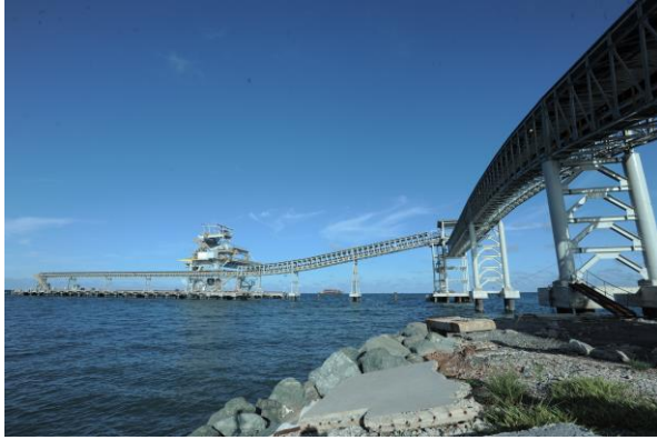
Continuous Barge Unloader