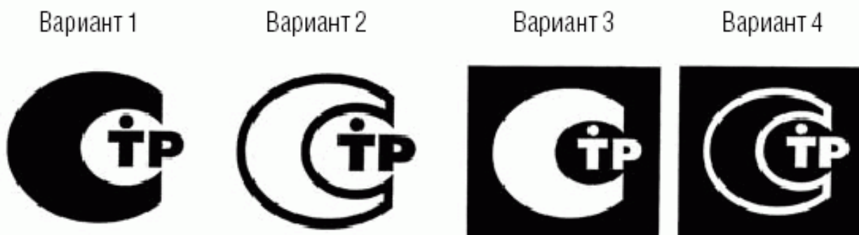
Рис. 2. Изображение знака обращения на рынке.

Знак обращения на рынке (рис. 2) применяется изготовителями (продавцами) на основании сертификата соответствия или декларации соответствия. Знак обращения на рынке проставляется на продукции и (или) на ее упаковке (таре), а также в сопроводительной технической документации, поступающей к потребителю при реализации.