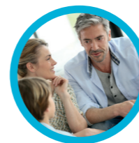
TUTORÍA CON LOS PADRES