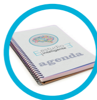
AGENDA DE ORGANIZACIÓN PERSONAL