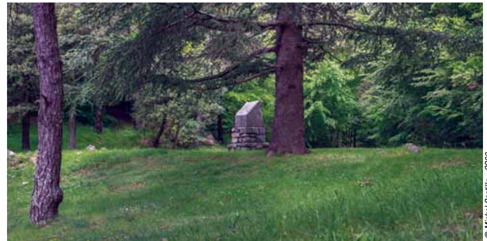
La stèle des évadés de Fontfrède.