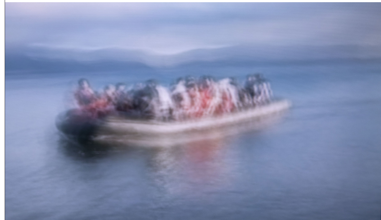
Raphaël Faon, Crise des migrants, 2016, tirage numérique sur toile tramée 18x31cm.