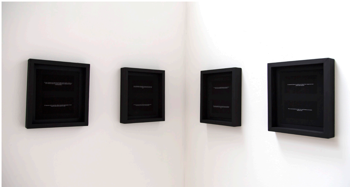
Adrien Van Melle, Séance, 2017, tirage numérique contrecollé, 21x25 cm

Fin 2017, L'ATELIER CHOQUE LE GOFF rejoint les éditions extensibles. Il est responsable de l'identité graphique de AU LIEU - les éditions extensibles et travaillera sur les prochains ouvrages, expositions et supports de communication de la maison d'édition.