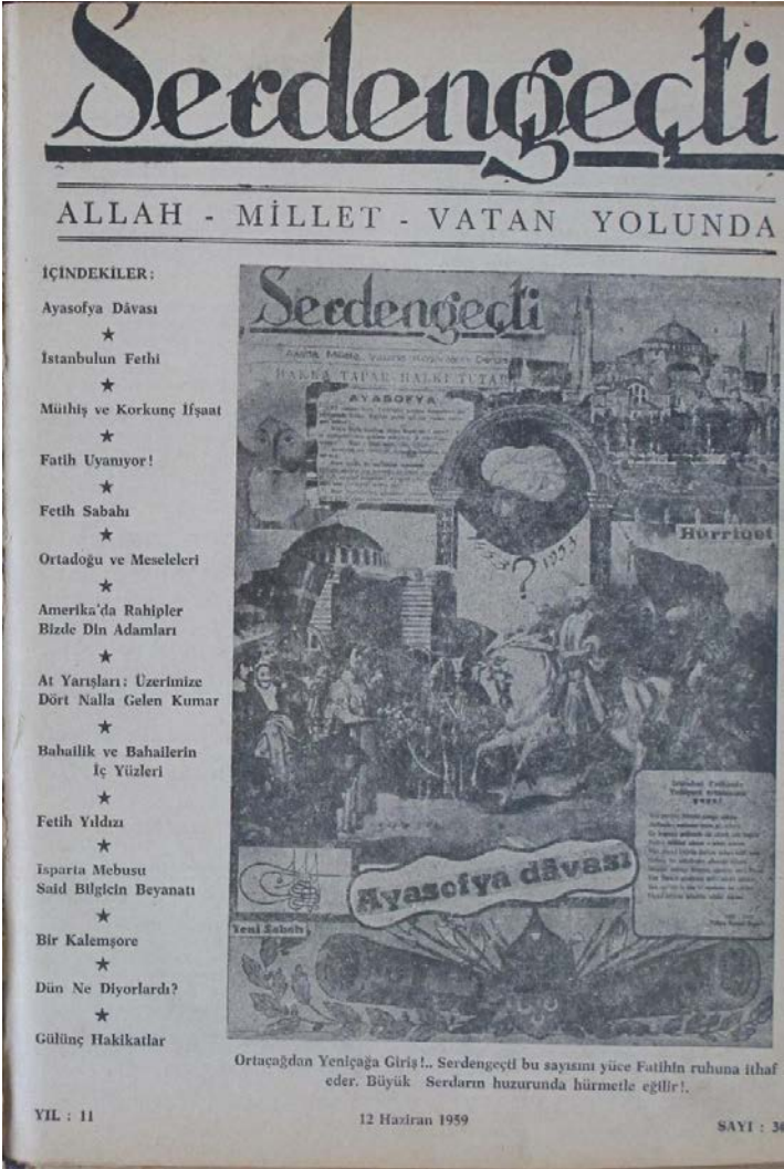
Serdengeçti dergisinin 30. Sayı Kapağı