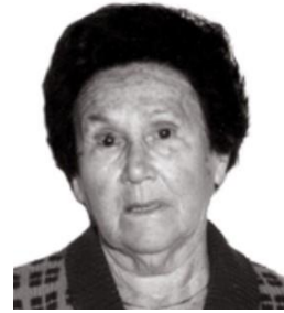
חווה חורש - Horesh