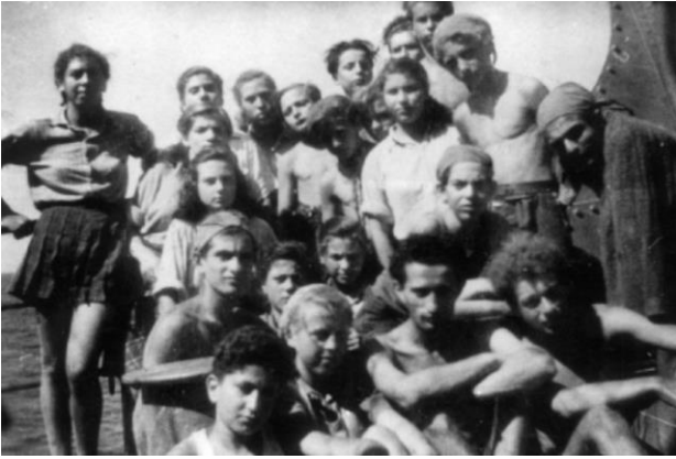
נערים ונערות על סיפון האמפייר רייבל