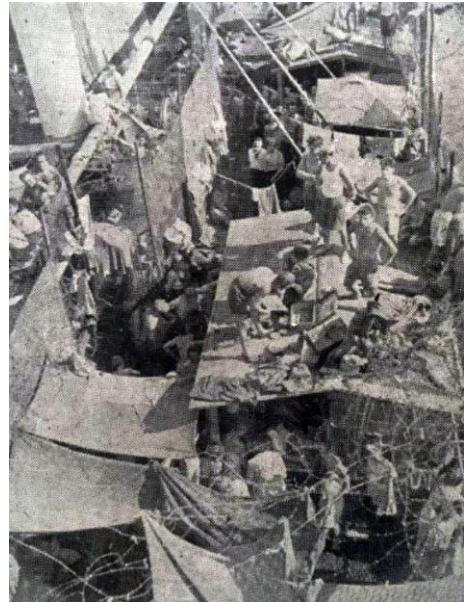
נערים ונערות ממוקמים על גג השירותים