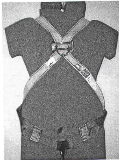
Gurt von hinten