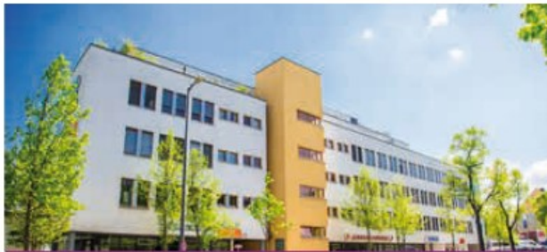
MAISON MÉDICALE Munich - Allemagne

Année d'acquisition : 2015 Année de construction : 2004 Surface totale : 4 600 m 2 Volume de l'investissement : 12 M€ Loué à 100 % à 1 clinique, 3 centres médicaux, 1 pharmacie et des personnes physiques