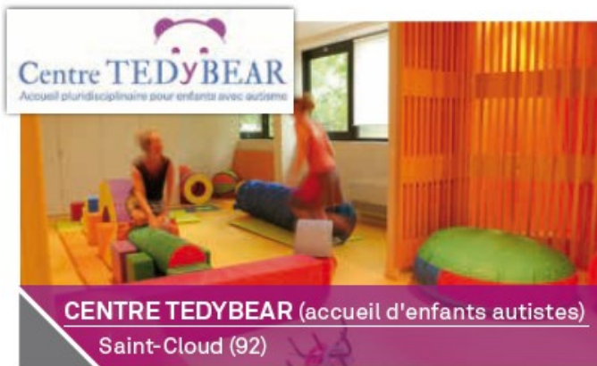
CENTRE TEDyBEAR (accueil d'enfants autistes) Saint-Cloud (92)

Année d'acquisition : 2015 Année de construction : 2014 Surface totale : 620 m 2 Volume de l'investissement : 2.25 M€ - indiv. 100 % Loué à 100 % au centre médico-social TEDyBEAR