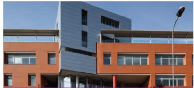
INTERNATIONAL SCHOOL OF MILAN Milan (Italie)

Année d'acquisition : 2015 Année de construction : 2004 Surface totale : 4 600 m 2 Volume de l'investissement : 12 M€ Loué à 100 % à 1 clinique, 3 centres médicaux, 1 pharmacie et des personnes physiques