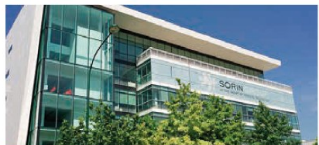
LABORATOIRES SORIN (SCI Clamart Vie*) Clamart (92)

Année d'acquisition : 2016 Année de construction : 1998 Surface totale : 6 202 m 2 Volume de l'investissement : 7.6 M€ - indiv. 100 % Loué à 100 % à DPUW