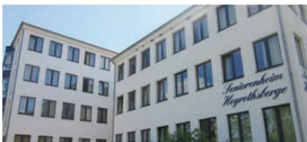
MAISON DE RETRAITE MEDICALISÉE Biederitz (Allemagne)

Année d'acquisition : 2016 Année de construction : 2013 Surface totale : 12 200 m 2 Volume de l'investissement : 36.3 M€ - indiv. 100 % Loué à 100 % à International School of Milan