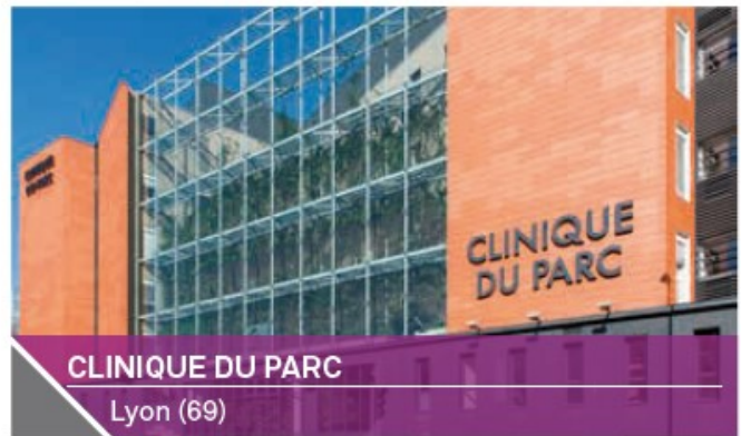
CLINIQUE DU PARC Lyon (69)

Année d'acquisition : 2015 Année de construction : 2014 Surface totale : 620 m 2 Volume de l'investissement : 2.25 M€ - indiv. 100 % Loué à 100 % au centre médico-social TEDyBEAR