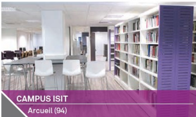
CAMPUS ISIT Arcueil (94)

Année d'acquisition : 2014 Année de construction : 2007 Surface totale : 16 328 m 2 Volume de l'investissement : 26.5 M€ - Indiv. 47 % Loué à 100 % à La Compagnie Stéphanoise de Santé