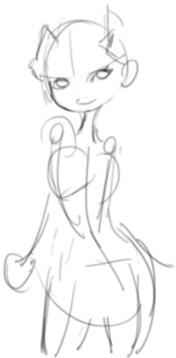
01 因為是卡通風格，所以在比例變化上面需要使用更誇張的手法來呈現。