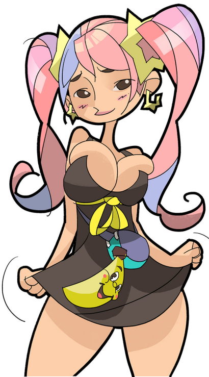
04 避免太多的漸層色系，僅取大塊面積來做兩階段的漸層變化即可。