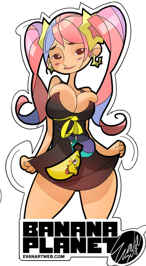
05 在人物的邊緣處添上一些淡淡的漸層色並描繪外框及LOGO字樣增加凝聚感。