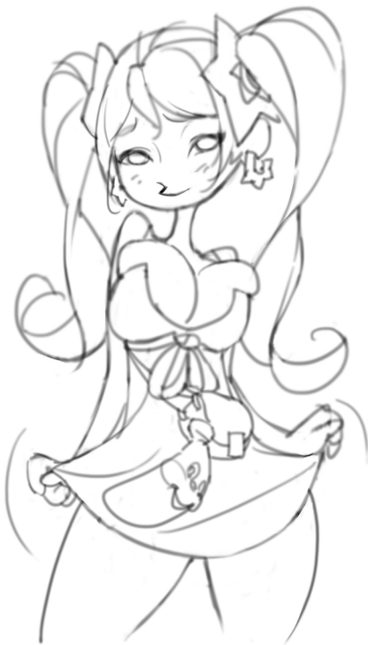
02 確保線條的流暢型，一些轉折處需要避免過多瑣碎的扭曲，以簡單為主。