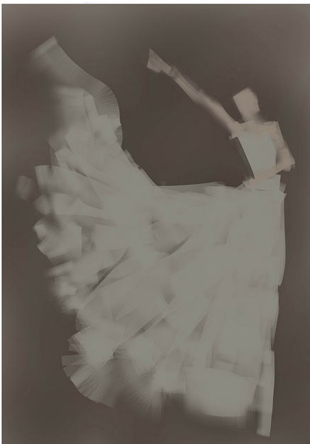
01先使用中間色調打底，運用筆刷感壓製造布料的層次感。