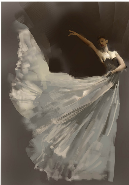
03開始混合不同圖層屬性以加強布的褶皺感的表現，人物打上陰影。