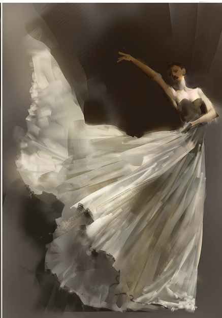
04疊上暗色去凸顯裙擺的波浪造型。