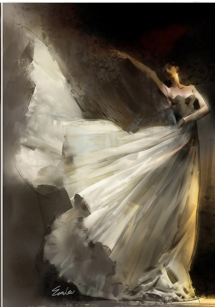
05簡單加上地板和右下的受光補色，強調整體氣氛，即完工。