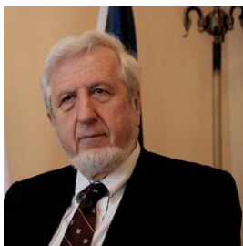
JESZENSZKY GÉZA történész, egyetemi tanár

energiaügyi helyettes államtitkár (2012)