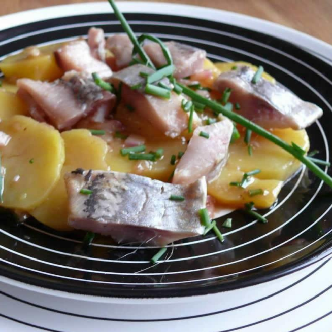
Nom: Salade de Hareng