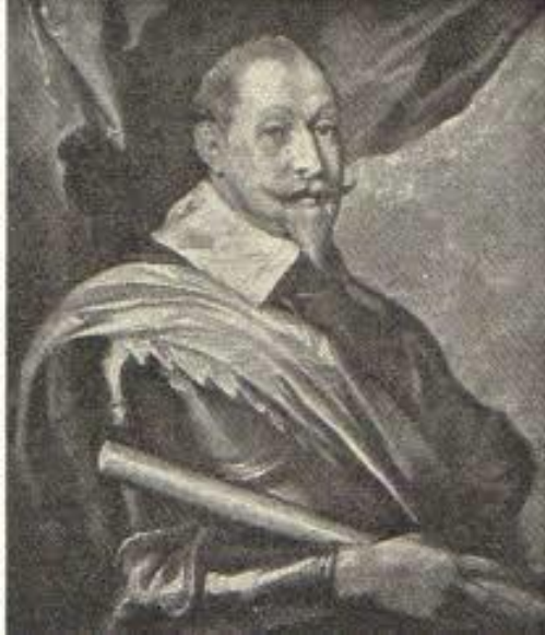
Gustave 2 Adolphe