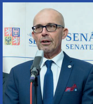
Petr Holeček, předseda senátorského klubu

Senátorky a senátoři klubu Starostové a nezávislí jsou velmi aktivní i v práci ve svých regionech a oblastech, ze kterých pocházejí. Navštěvují obce a pomáhají starostkám a starostům obcí s problémy, které jsou pro ně občas neřešitelné. Většinou jsou spojené - bohužel - s byrokracií a nezájmem státu či nadřazených orgánů. Zároveň se ale i podílejí na odborných konferencích a „kulatých stolech“, v Senátu pořádaných, ať už se týkají vzdělání či ochrany přírody, nebo na pomoci chudším regionům.