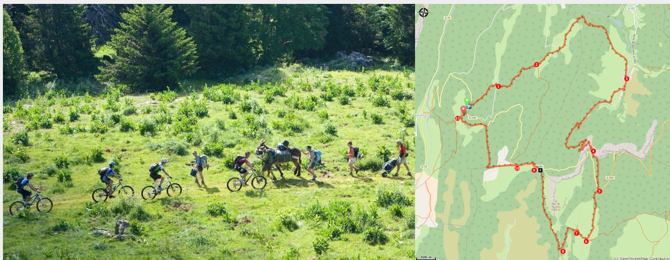
Le Plateau d'Ambel (PNRV)

Pour les plus sportifs passionnés de VTT, ce circuit complet et varié est taillé pour vous !