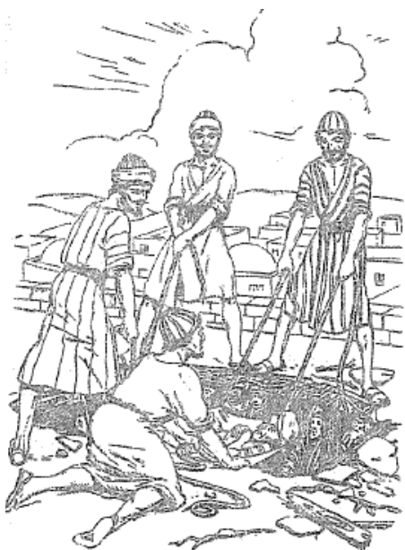
Bajando al paralítico por la abertura del techo

Por último, el don de sanidad se supone que sea como el don de profecía (el de predecir sucesos futuros). Con este don de profecía tienes que acertarlas todas , si fallas solo 1 ya estás bíblicamente declarado como FALSO PROFETA. ¡¡¡Todas las profecías de un Profeta de Dios se tienen que cumplir palabra por palabra... SIN EXCEPCION!!! “SI EL PROFETA HABLARE EN NOMBRE DE Jehová, y no se cumpliere lo que dijo, ni aconteciere, es palabra que Jehová no ha hablado; con presunción la habló el tal profeta; no tengas temor de él” (Deuteronomio 18:22 RVR 1960).