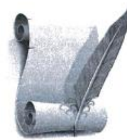
Testimonios de lectores (Aniversario #30)