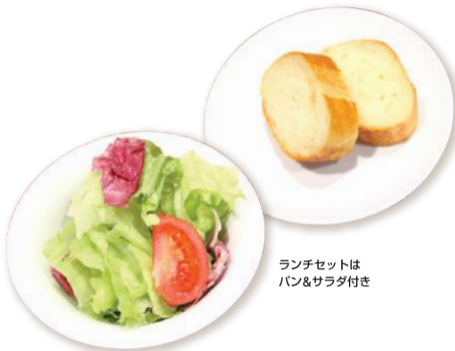
ランチセットはパン&サラダ付き