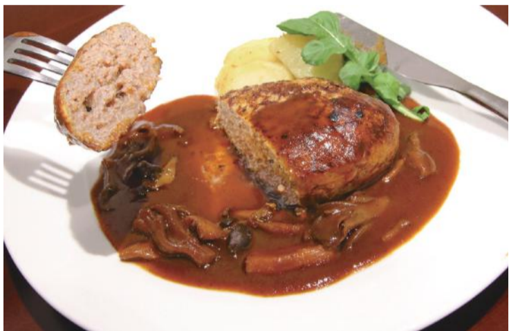
ハンバーグステーキ きのこソース 1,200円(税込)

感の海老など、新鮮な魚介はどれもその大きさに驚かされます。それから、ほんの少しフォークで押しただけでじゅわ〜と滲み出てくる肉汁が食欲をそそるハンバーグステーキもおススメ。ゼロからすべて手作りという秘伝のデミグラスソースは、すっきりとした酸味の中に深いコクと旨味が広がり、最後に鼻から抜ける華やかな香りまで楽しめます。ご主人と奥さま2人で切り盛りする小さなお店なので、5名以上で来店する場合には予約をお忘れなく。ちなみに、看板のイラストは奥さまの直筆なのだとか。コック帽を被った凛々しい猫・え、猫でなくシェフに見える？ それはきっと、髭を描き忘れたせいです。