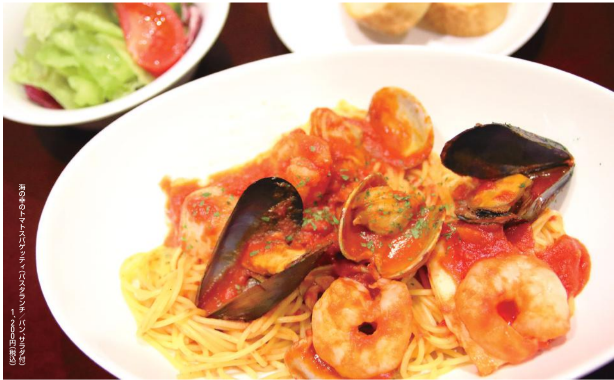
海の幸のトマトスパゲッティ(パスタ1人前) ¥1,200(税込)

多くの文豪が愛した老舗『山の上ホテル』で20年以上に亘って腕をふるい、別館で料理長まで務めたオーナーシェフが、満を持して生まれ育った地元におオープン。毎朝、市場まで出掛け、ご自分の目で見て仕入れるという旬の厳選食材を使用したこだわりのイタリアンが人気です。パスタランチの海の幸のトマトスパゲッティは、トマトのフレッシュな酸味が細めのスパゲッティに絡まって美味。しっかりと歯応えにもかかわらずすんなり噛み切れる柔らかいモンゴウイカやブリブリ食