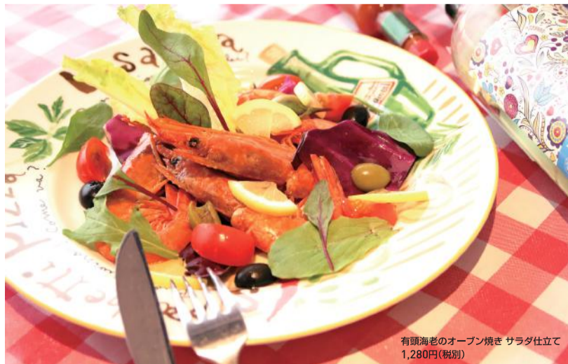
有頭海老のオープン焼き サラダ仕立て 1,280円(税別)

ターは、アツアツのお鍋で供される見た目からして、一般的なスープパスタの概念をひっくり返される逸品です。使用するパスタはなんと120g。場所は違えど商店街で生まれ育ったご主人、町の定食屋さんのようにお腹いっぱいになって欲しいという思いで、ポリユミーにしているそうです。それから自家製ドレッシングでいただくサラダもおススメ。ご主人自ら醸す味噌と生クリームが味の決め手というバーニャカウダも人気です。店内の黒板には、独自の仕入れルートで産地にもこだわった旬の魚介をたっぷり使用したオリジナルメニューがずらり。運が良ければ、聞いたこともないような珍しい魚介を味わうことができるかも知れません。