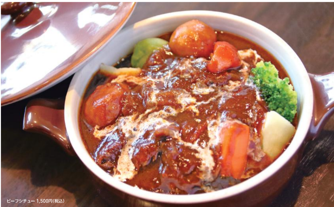
ビーフシチュー 1,500円(税込)

豚肉には山形庄内の三元豚を使用した り、口当たりも後味も滑らかな有機栽培の コーヒーを使用したり、テイクアウトで冷 めても美味しいよう油やお米にもこだわっ たりと、随所にシェフの矜持が窺えます。 詳しくは公式HPでご確認ください。 二代目が「最も忘れられない父の味」と いうタンシチューは、食材が入った時にし か作らない隠れた逸品。メニューには載っ ていませんのでご注意を。