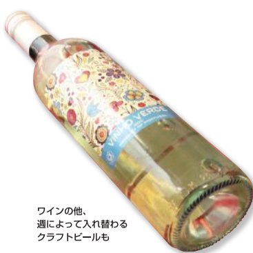
ワインの他、週によって入れ替わるクラフトビールも