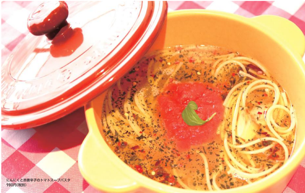
にんにくと赤唐辛子のトマトスープパスタ 980円(税別)

から50年近く前のこと。幼くしてニューヨークに渡った一人のイタリア人が生み出したピザの味に、たまたま訪れた日本人が惚れ込み、東京へと持ち帰りまします。その味は数人のイタリアンシェフに継承され、奥沢や代官山などで人気を集めました。そのうちの一人がこちらのご主人。今ではもう、ここでしか食べることができない幻の味です。そんなご主人が復活させたのは、ピザだけではありません。まだその呼び方もなかった頃から親しまれた元祖「スープパス