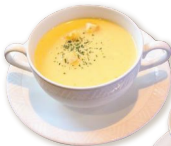
ポタージュスープ 450円(税込)

おかげさまで、かなまちLiveも40号。 この度、紙面を大幅にリニューアルすることとなりました。 新しく生まれ変わった本紙を記念して、 新しくかなまちエリアにオープンしたレストランを大特集します。 復活した地元の老舗洋食に、有名ホテルの味を継承したイタリアン、 そしてここでしか味わえない幻のピザと、どれも本格的な西洋料理ばかり。 春のおでかけついでに、ぜひ立ち寄ってみてはいかがでしょうか。