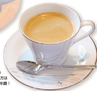
森のコーヒー 380円(税込) ※お食事と一緒にご注文の方は 100円引き&お替わりは半額!