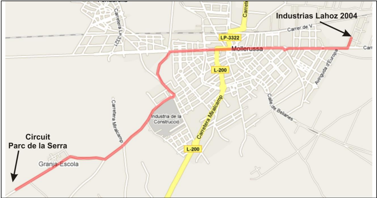
Ubicación y accesos Taller previsto para las verificaciones