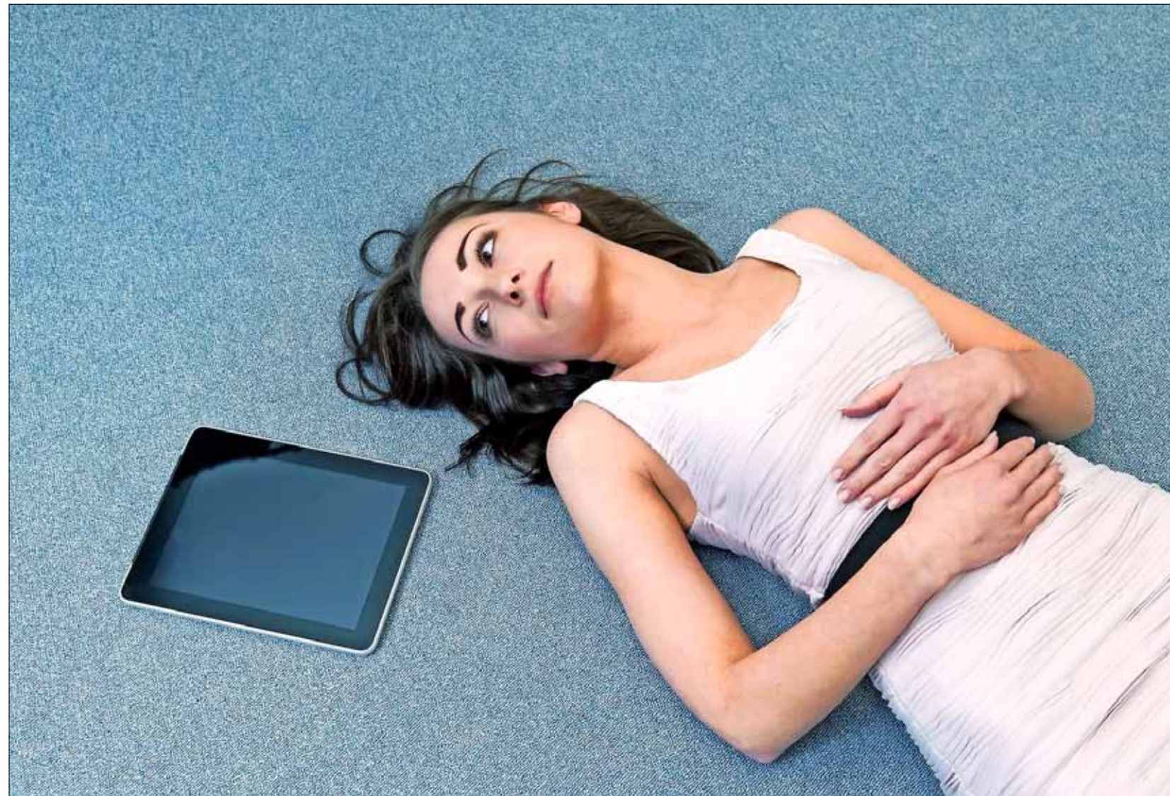
In een samenleving die voluit de kaart van de digitalisering kiest, vergt bewust omgaan met het internet almaar vaker een inspanning.

We staan er zelden bij stil, maar zo'n twintig jaar geleden hadden de meesten onder ons het wereldwijde web nog niet ontdekt. Toen moest je zelfs iemand met een mobiele telefoon zoeken met een vergrootglas. Vandaag is het net andersom. Mensen die zich bewust afzijdig houden van elke digitale activiteit, ook al kunnen ze zich best een internetabonnement veroorloven en beschikken ze over de vereiste vaardigheden, zijn dun gezaaid. Is er leven mogelijk zonder het internet? En kun je offline meedraaien in onze almaar sneller digitaliserende samenleving of mis je dan van alles?