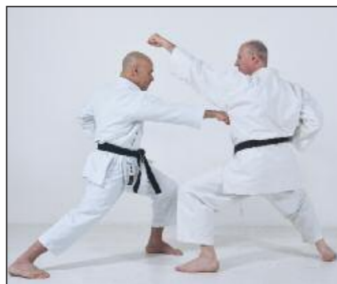
Blocage Age-uke de Hamiche sur une attaque Oi-zuki de Courtonne, contre en gyaku-zuki.