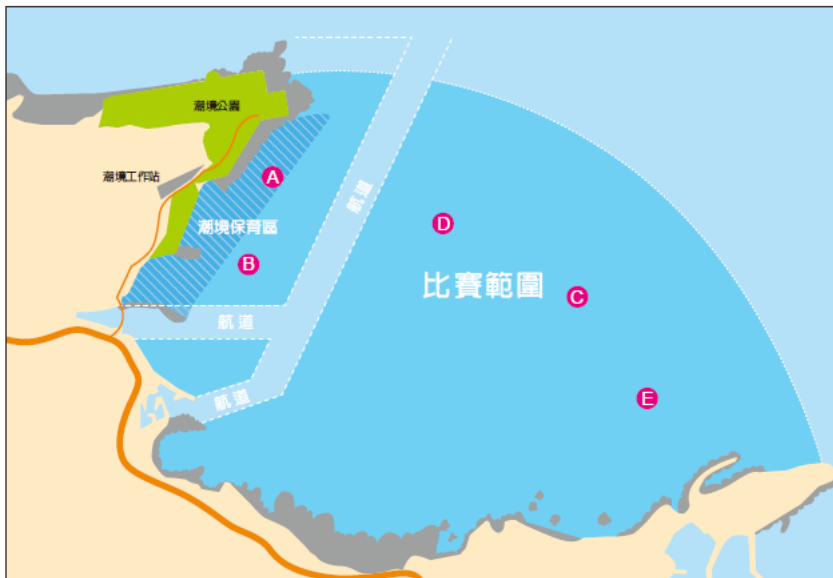
圖一/ 拍攝區域示意圖

比賽作品限制範圍必需是「潮境海灣」所拍攝，以凝聚焦點於保育區為主要目的，請依循比賽範圍規範，避開船隻航道以確保安全。