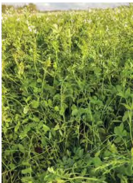
Testblandingen CarbonFarm 2019 ved Arne Skou i Rødding. Blodkløver og vikke sikrer vækst henholdsvis både lavt og højt i plantemassen. Sået 27. juli 2019. Foto 25. oktober 2019.

shopFRDK lancerer i år TG-CarbonFarm 2020, der er en blanding til frivillige efterafgrøder bestående af arter, der er driftssikre under de fleste forhold. Vil du kræse for detaljerne, kan den suppleres med andre arter afhængigt af, hvordan sæsonen udvikler sig inden etablering.