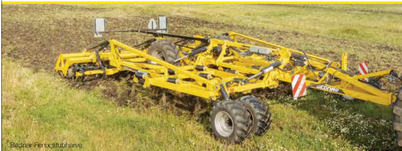
Bednar Fenix stubharve.