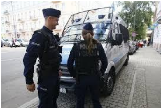
Ryc. 4

Niestety odnotowano większą liczbę zabitych na polskich drogach stan na lipiec 2019 r. to ponad 12% więcej zabitych w porównaniu do podobnego okresu roku 2018 – to bardzo niepokojąca informacja!