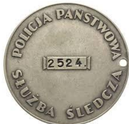
Ryc. 2 Źródło:

powstającego, po okresie zaborów, państwa, jak również konieczność stawienia czoła poważnym wyzwaniom w zakresie bezpieczeństwa mieszkańców, w pierwszych latach II RP. Wyzwanie podjęte przez twórców Policji Państwowej, z dzisiejszej perspektywy, było niezwykle trudne w kontekście konieczności unifikacji procedur, praktyk i zasad dotyczących służby policyjnej oraz wdrożenia ich w życie w każdej części znacząco zróżnicowanego i stale zagrożonego kraju. Podkreślenia wymaga fakt, że policjanci, jednostki PP były istotnym elementem budowy polskiej państwowości w każdej części kraju i stanowiły o jego sile, szczególnie w