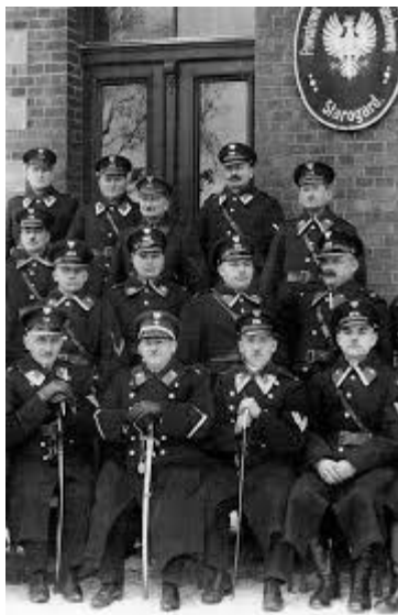
Ryc. 1

24 lipca 1919 roku na mocy ustawy o Policji Państwowej (Dz.Pr.P.P. 1919 nr 61 poz. 363)