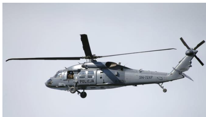
Ryc. 3

Budżet, w kwocie prawie 10 mld zł (ok. 0,5 % PKB) pozwala na realizację zadań policyjnych, mimo, że nie w pełnym wymiarze. Struktura formacji i jej zasoby dają szansę na kontrolę przestępczości i budowanie poczucia bezpieczeństwa mieszkańców oraz wskazują na wiodącą