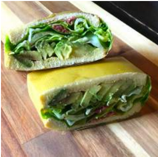
●グリーンベジサンド (アボカド/レタス/キヌア/ ベリーソース)