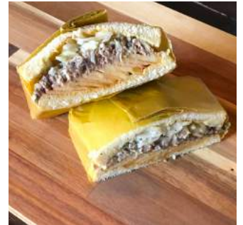
●サバリンゴサンド (サバ/リンゴ/玉ねぎ/ケッパー /豆乳マヨネーズ)