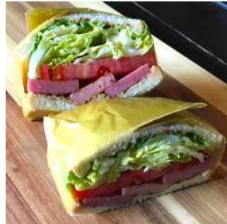
●BLT (ベーコン/トマト/レタス 豆乳マヨネーズ/粒マスタード)