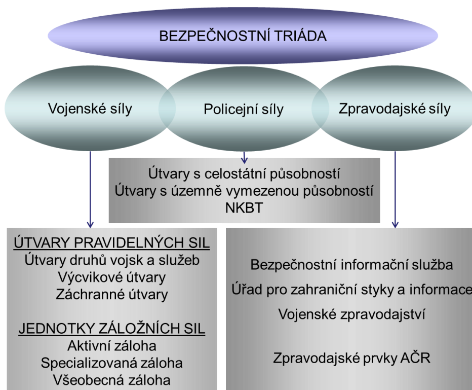
Obrázek 2 – Bezpečnostní triáda a její složky