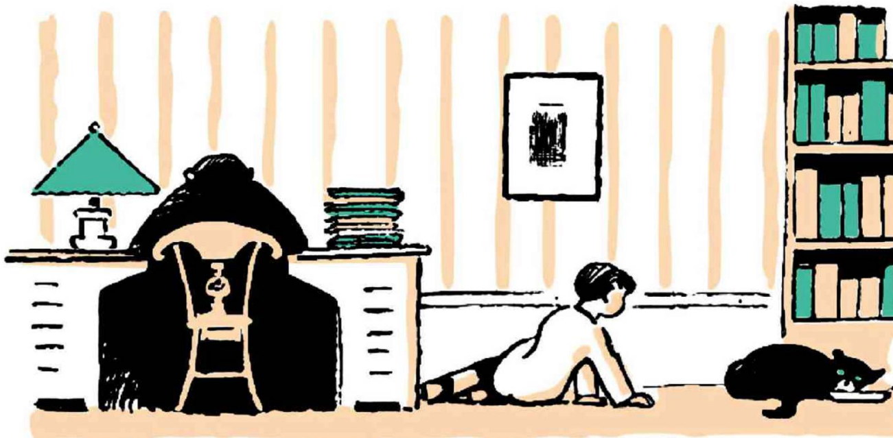
ANDRÉ HELLÉ, DIVULGAÇÃO

Com ilustrações de André Hellé, livro com o personagem Patachu foi lançado na França em 1930