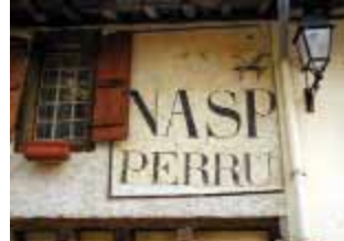
Blaireau et bol à raser renvoient explicitement à l'activité de perruquier, profession de l'ancien propriétaire de cette boutique.

Siège du comté d'Astarac au même titre que les châtelainies de Moncassin, Villefranche et Durban dès sa fondation au XII e siècle et avant que les comtes ne s'installent à Mirande au XIV e , Castelnaud-Barbarens a conservé son aspect de bourg perché médiéval dominant la vallée de l'Arrats.