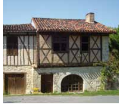
Plusieurs maisons ont conservé leur façade en pan de bois, associant le colombage à la pierre locale, à des briquettes ou au torchis.

L'église romane St-Martin de Pépieux abrite des vestiges issus d'une villa gallo-romaine voisine et comporte un clocher-mur refait en 1754. L'église St-Géraud de St-Guiraud porte la date de 1741 sur une ouverture murée du chevet, mais certaines parties sont plus anciennes ; elle appartient au propriétaire du château attenant.