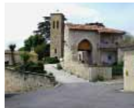
Haute de 20 mètres, la tour-clocher a successivement fait partie du château puis de l'église St-Nicolas. Au premier plan : l'une des portes du castelnaud.