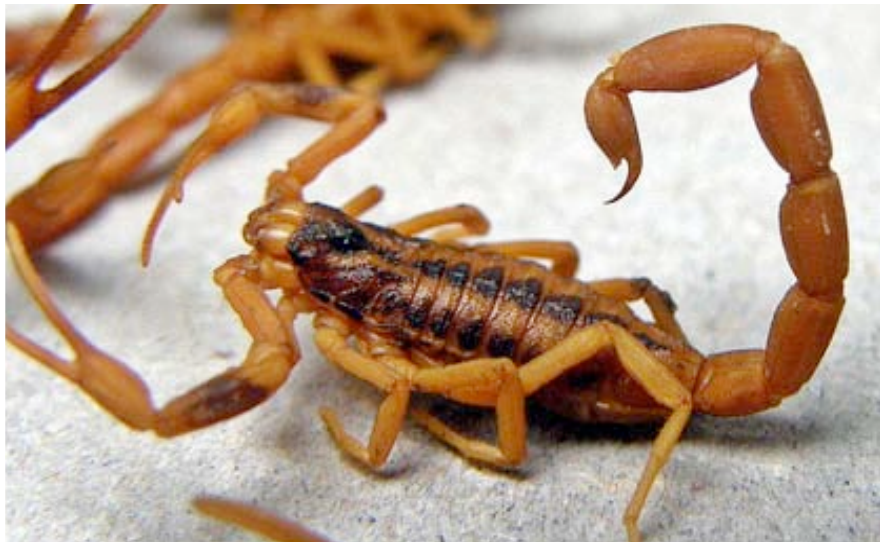
Tityus trivittatus .

Un trabajo del Doctor de Roodt describe el perfil bioquímico y nivel de toxicidad hallado en muestras de veneno de ejemplares de Tityus trivittatus que fueron recolectados en diversos puntos del país. “Los compuestos tóxicos parecerían ser los mismos en los ejemplares de las diferentes provincias pero la variación en toxicidad puede ser muy importante”, destacó de Roodt, y continuó: “Esta variabilidad tóxica de los venenos se observa no solo en escorpiones sino en otros animales venenosos y es congruente con la función primaria del veneno, que es paralizar a la presa. Puede deberse tanto a adaptaciones por el tipo de presa del cual debe alimentarse el animal en las diferentes zonas, como a la carga genética de las diferentes poblaciones. En el caso de la Ciudad de Buenos Aires, hasta la fecha todas las muestras que se han estudiado presentan una toxicidad mucho menor que las de otras partes del país. ”